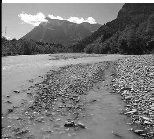
Le WWF s'engage pour la Kander.

www.wwf-be.ch , à la rubrique Mediendokumente