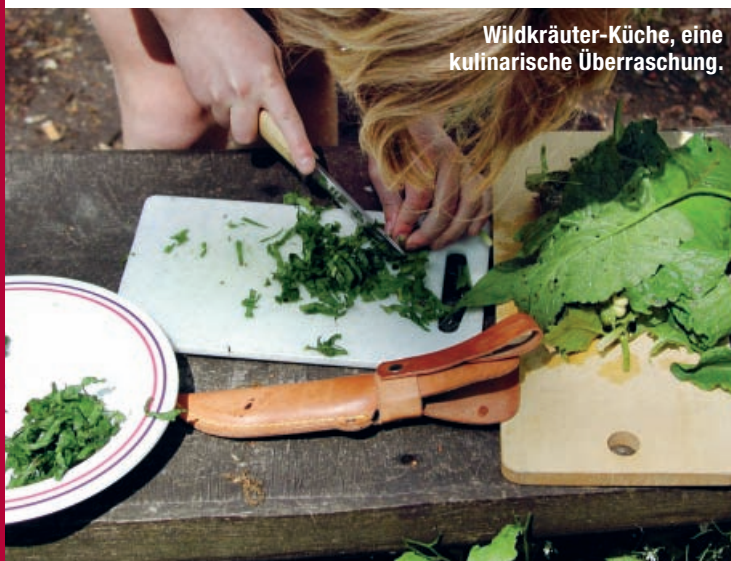
Wildkräuter-Küche, eine kulinarische Überraschung.

Weitere Anlässe der Regionalgruppe sind unter www.wwf-be.ch zu finden.