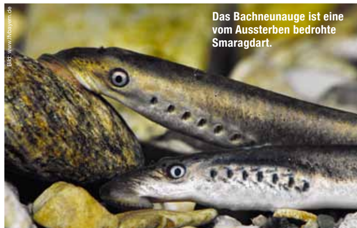
Das Bachneunauge ist eine vom Aussterben bedrohte Smaragdart.